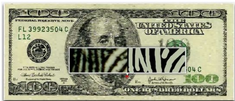
"Ten Thousand Cents" de Aaron Koblin y Takashi Kawashima.

El español César Escudero Andaluz , uno de nuestros artistas más internacionales en este ámbito, participa con distintas obras de su serie File_món , un ejercicio de reciclaje visual , que se abastece de imágenes encontradas en la red y toma forma en el fondo de escritorio del artista . "Sin necesidad de herramientas diseñadas para su manipulación, estas imágenes encontradas son incorporadas al escritorio del ordenador, donde mediante la superposición y distribución de iconos se transforma su superficie , ocultando pequeñas parcelas de información y modificando su significado , antes de devolverlas al entorno de dónde fueron sacadas", explica Escudero al Silicio .