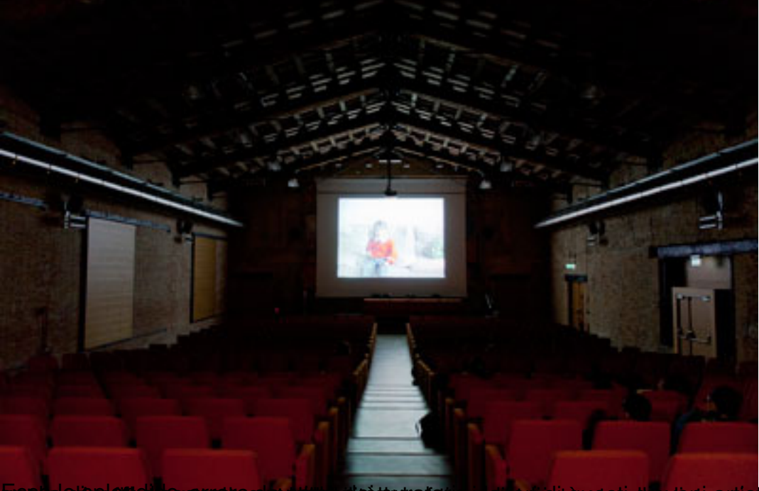
È un lavoro che si è sviluppato in un periodo di tempo molto breve, in un luogo storico di www.mediterranea16.org , in un'aula di teatro, a cura di Claudia Palevski. Running time: 25' | www.mediterranea16.org , curato da Paola Pirelli, con la collaborazione di Paola Pirelli, Francesca