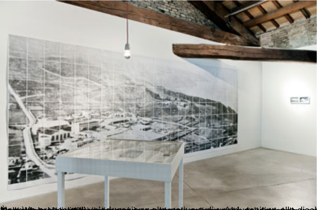
Il titolo scelto dall'artista è "Errors Allowed" e si riferisce alla disomogeneità, alla