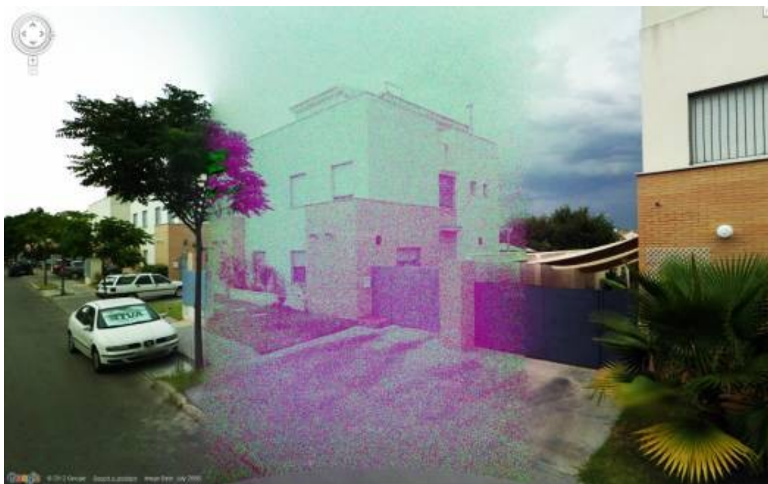
THE GOOGLE TRILOGY - 1. Report a Problem, #76/100 (2012), fotografia digitale, dimensioni variabili

e comprensione del mondo. Mi è indispensabile mantenere una metodologia flessibile, dunque continuerò a sperimentare muovendomi tra teoria e pratica».