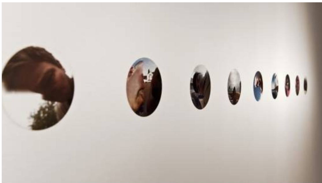
THE GOOGLE TRILOGY - 3. The Driver and the Cameras , (2012) 11 fotografie su carta fotografica. X: 210cm; Y:10cm. vista dell'installazione presso Jarach Gallery, Venezia

«Tra i temi ricorrenti nel mio lavoro c'è la memoria, il rapporto tra realtà online ed offline, il lavoro immateriale, e la relazione tra uomo e potere tecnologico. Nel mio lavoro ho spesso lavorato attraverso la fotografia, ad esempio indagando la tecnologia di riconoscimento facciale in Facebook ( Digital Pareidolia ), fotografando scene di Google Street View prima che venissero censurate e cancellate ( The Google Trilogy ) o scrivendo le mie memorie all'interno del codice Ascii di vecchie foto di famiglia alterandole in modo imprevedibile ( The sicilian family ). Trovo molto importante muovermi costantemente da un medium all'altro e nonostante una predilezione per l'immagine mi trovo a mio agio sperimentando con nuove tecnologie tanto quanto con media più tradizionali».